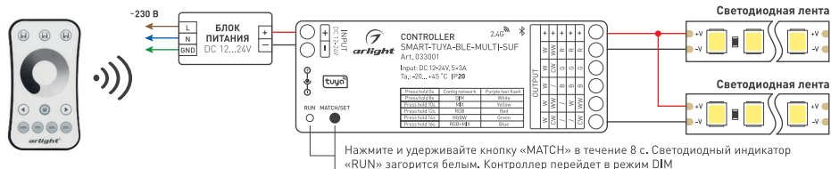
Рисунок 1. Схема подключения контроллера SMART-TUYA-BLE-MULTI-SUF